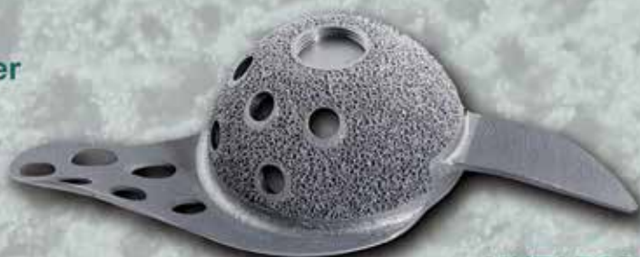
MUTARS® RS cup