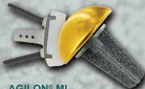
AGILON® MI metaphyseal implant